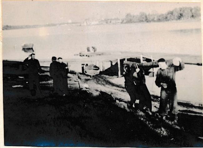
Ühisel tööl klubi korras- tamisel käivad õhtutunnid

Vastavalt sõudesektsioo- ni juhatusse seisukohale, hak- kab ehitustööde käiku valgus- tama vastav bulletään, millie ne hakkab ilmuma kaks korda kuus kahel leheküljel. Esime- ne number ilmub 30. juunil.