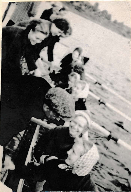
Fotomälestus 1957. a. suvehooajast.